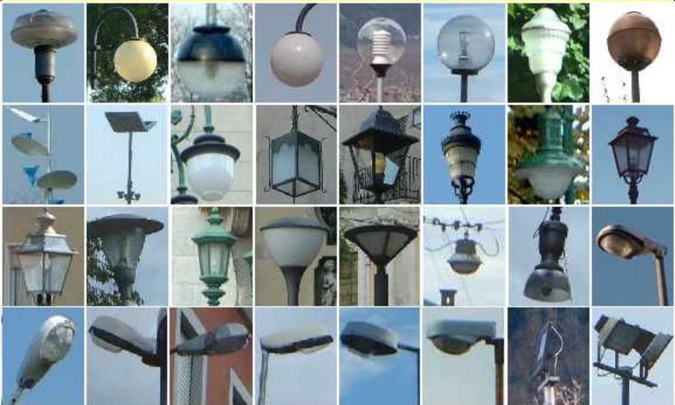
Figura (sopra) Esempi di corpi illuminanti obsoleti ed inquinanti non rispondenti ai criteri indicati dal presente regolamento. Non utilizzare questi prodotti per nuove installazioni

c) Anche in questo caso é preferibile utilizzare corpi illuminanti cut-off, e, in ogni caso, non dobbiamo superare i limiti di emissione massima previsto per tali genere di ottiche. E' comunque, sempre, preferibile utilizzare corpi illuminanti con lampade completamente incassate, in modo da limitare la dispersione di luce e limitare l'impatto visivo.