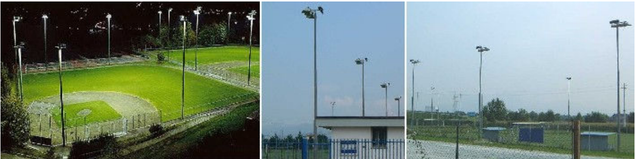
Figura (sopra) Esempi di corretta illuminazione di impianti sportivi

d)Ad esempio, nel caso specifico degli impianti sportivi, in molti casi può essere determinante al fine di contenere l'inquinamento luminoso e l'abbagliamento rivedere l'inclinazione dei proiettori in modo da assicurare livelli di emissione massima in linea con quanto previsto per l'illuminazione di grandi aree; inoltre possono essere installati nella parte superiore dei proiettori appositi schermi metallici atti a contenere la dispersione verso l'alto.