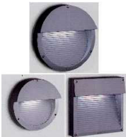
Figura (sotto) ottimi apparecchi completamente schermati da utilizzare per percorsi interni, segna passo ed illuminazione residenziale in genere

Gli impianti esistenti, non conformi a tali caratteristiche tecniche e non rientranti nelle deroghe sopra descritte si adeguano con procedure anche a basso costo alle indicazioni tecniche riferite per detto genere di ottica. Dopo la procedura di adeguamento la dispersione massima non può essere superiore al 3% come stabilito dall'allegato A della L.R. 39/2005.