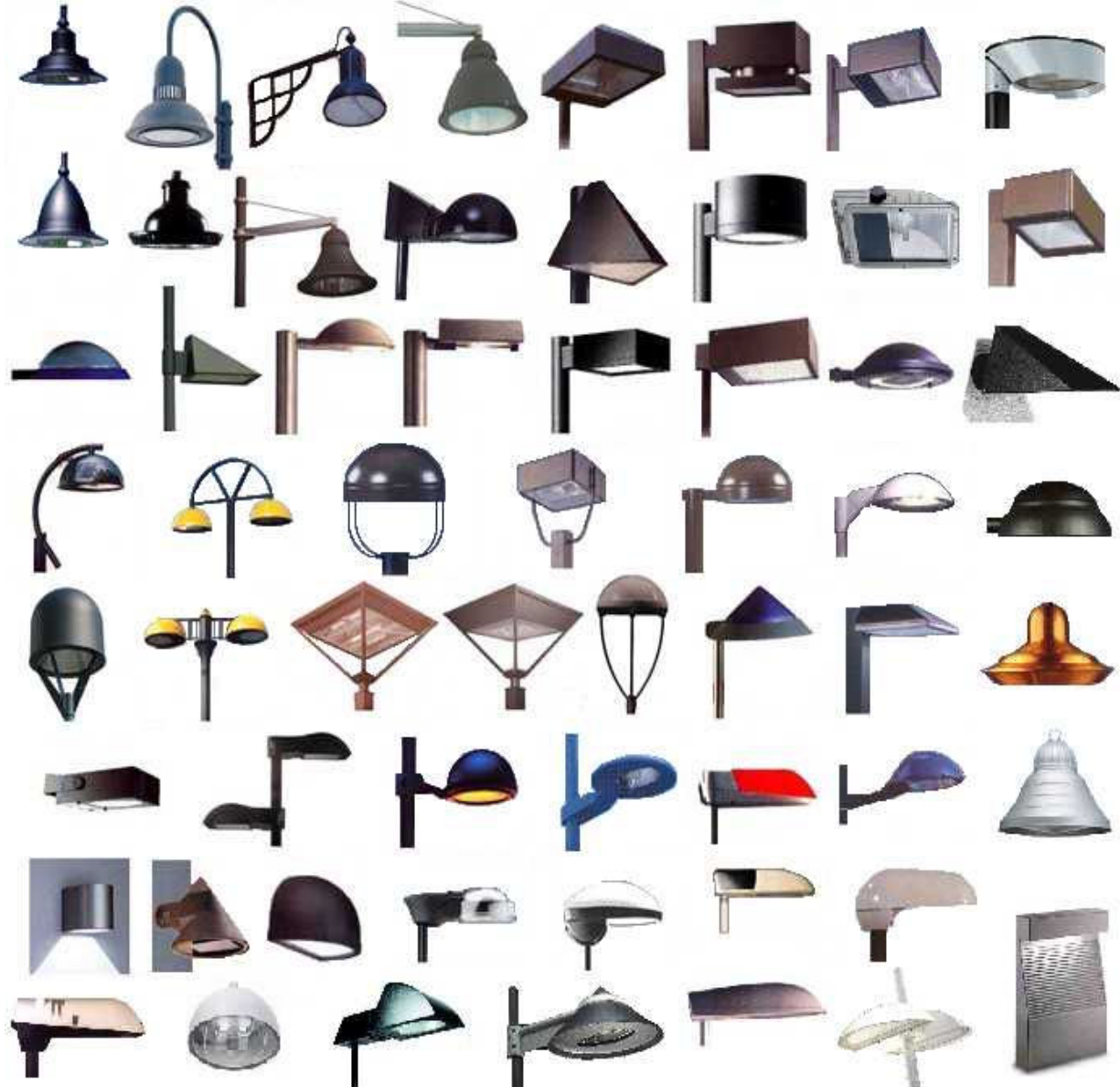
figura (sopra) Esempi di prodotti cut-off da utilizzare per l'illuminazione di strade, parcheggi, zone residenziali, ecc.